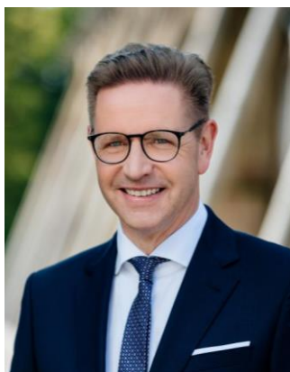
Ulrich Berger Bürgermeister der Stadt Salzkotten

Wir wünschen euch schöne Sommerferien, unvergessliche Erlebnisse bei den diesjährigen Ferienspielen sowie allen Beteiligten gutes Gelingen bei der Durchführung.