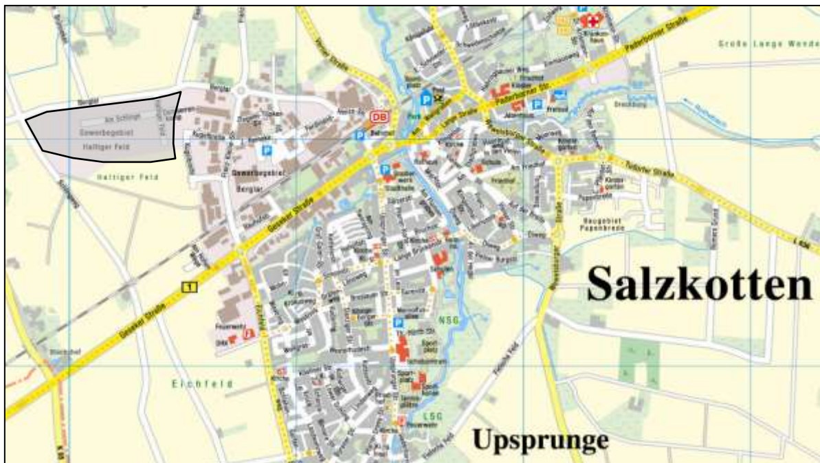
Lage GEWERBEPARK HALTIGER FELD